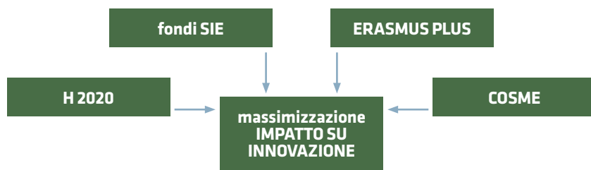
Modello di sinergia tra Fondi Strutturali (SIE) e altri programmi di finanziamento dell'Unione Europea

ropa 2020 rivolta ad attuare una crescita intelligente, sostenibile e inclusiva all'interno dell'Unione Europea. La sinergia tra questi indirizzi politici costituisce infatti una delle priorità strategiche dell'intera Programmazione Europea 2014-20.